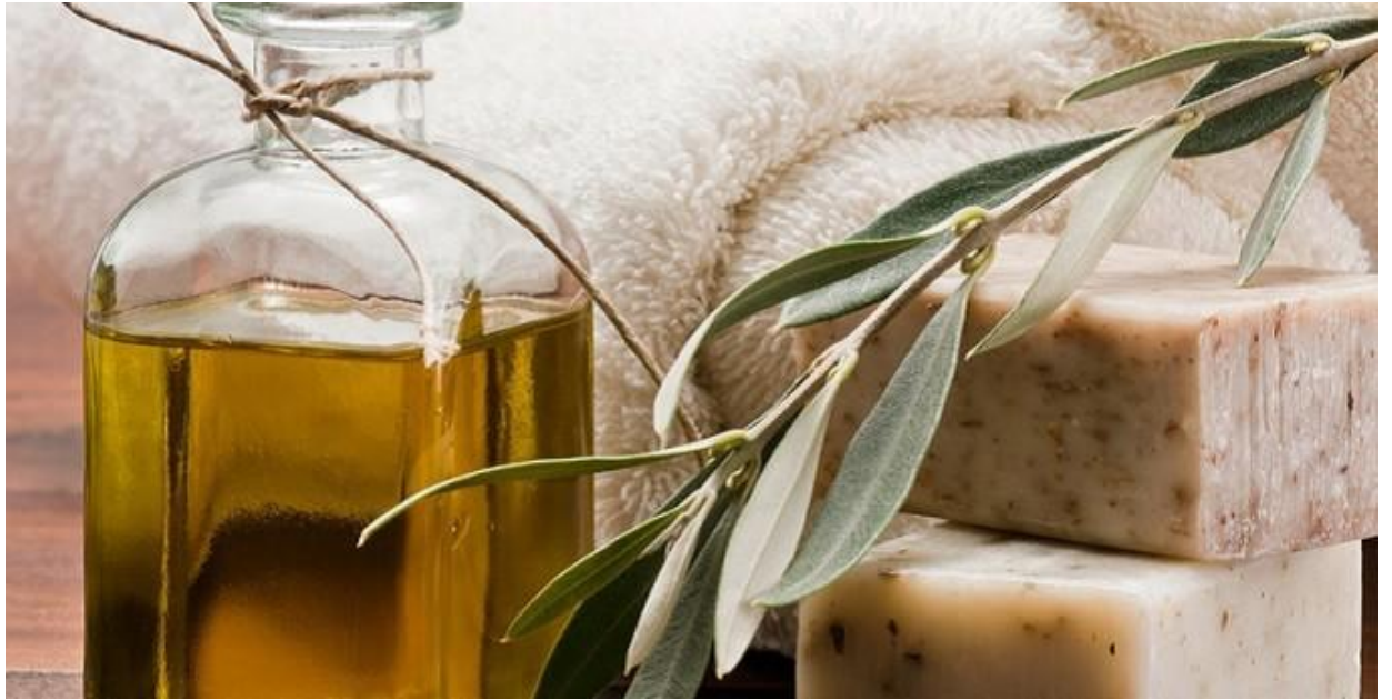
Το κρητικό ελαιόλαδο και το σαπούνι

Η ζήτηση για το κρητικό ελαιόλαδο ξεκίνησε να αυξάνεται και η εξαγωγή του να γίνεται περιζήτητη. Κατά την περίοδο του 18ου με 19ου αιώνα η σαπωνοποιία άρχισε να αναπτύσσεται και στην Κρήτη, επιστρέφοντας, θα λέγαμε, στην αρχαία πατρίδα της.