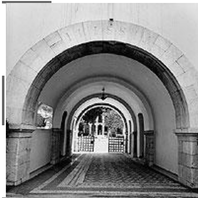
Άποψη της εισόδου του Μουσείου

Βυζαντινό και Χριστιανικό Μουσείο της Αθήνας είναι ένα από τα σημαντικότερα δημόσια μουσεία στην Ελλάδα. Ιδρύθηκε στις αρχές του 20ου αιώνα (1914) με σκοπό τη συλλογή, μελέτη, διατήρηση και έκθεση της Βυζαντινής και Μεταβυζαντινής πολιτιστικής κληρονομιάς στην ελληνική επικράτεια.