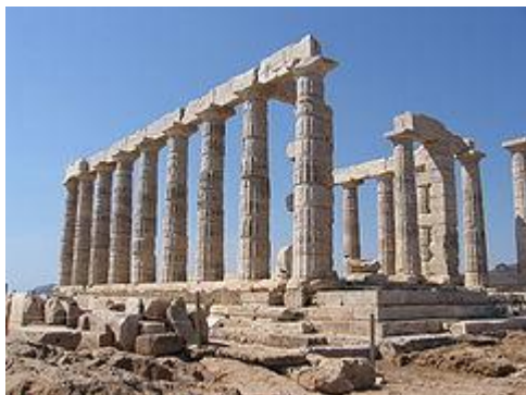
Ο ναός του Ποσειδώνα στο Σούνιο

Στον χώρο της Αττικής υπήρχαν μερικοί από τους σημαντικότερους λατρευτικούς χώρους της αρχαίας Ελλάδας. Ο σημαντικότερος λατρευτικός χώρος ήταν η Ακρόπολη στον οποίο λατρευόταν η θεά Αθηνά. Η ακρόπολη ήταν ο σημαντικότερος λατρευτικός χώρος της θεάς Αθηνάς στην αρχαία Ελλάδα. Μετά την αποχώρηση των Περσών το 479 π.Χ. ανοικοδομήθηκαν στην Ακρόπολη εντυπωσιακά μνημεία κάτω από την επίβλεψη των σημαντικότερων αρχιτεκτόνων και γλυπτών της αρχαιότητας όπως του Φειδία, του Ικτίνου, του Καλλικράτη κ.α.