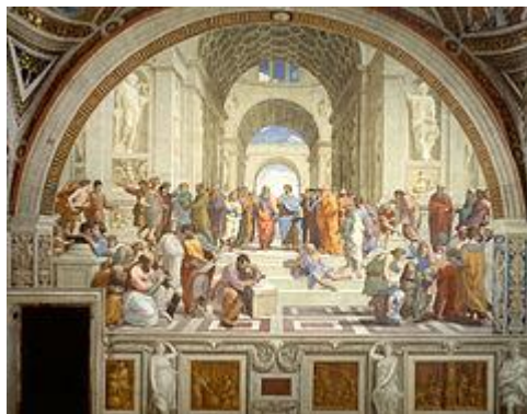
Η Σχολή των Αθηνών. Έργο του Ραφαήλ

Σε καμία άλλη πόλη της αρχαίας Ελλάδας δεν αναπτύχθηκαν τόσο πολύ οι τέχνες και τα γράμματα όσο στην αρχαία Αθήνα καθώς εκεί αναπτύχθηκαν οι κατάλληλες συνθήκες για να υπάρξει αυτό το αξιοθαύμαστο πολιτιστικό δημιούργημα. Οι λόγοι που αυτό συνέβη ιδιαίτερα στην Αθήνα ήταν η ύπαρξη δημοκρατικού πολιτεύματος, η μεγάλη εισροή πλούτου στην πόλη, αλλά και η έντονη συναναστροφή και ανταλλαγή ιδεών με ξένους λαούς και πολιτισμούς μέσω του ιδιαίτερα ανεπτυγμένου Αθηναϊκού εμπορίου. Το μεγαλύτερο μέρος του πολιτιστικού δημιουργήματος της αρχαίας Ελλάδας οφείλεται στην Αθήνα. Εκεί δημιουργήθηκε το θέατρο, πρωτοεφαρμόστηκε το δημοκρατικό πολίτευμα, αναπτύχθηκε η φιλοσοφία, η ιστοριογραφία, η ρητορική, η γλυπτική, η αρχιτεκτονική κ.α. Από την Αθήνα ήταν μερικές από τις μεγαλύτερες προσωπικότητες των γραμμάτων και των τεχνών της αρχαιότητας, όπως οι Δραματικοί ποιητές [21] Αισχύλος, Σοφοκλής, Ευριπίδης και Αριστοφάνης, οι φιλόσοφοι Σωκράτης και Πλάτωνας, οι ιστορικοί Θουκυδίδης και Ξενοφώντας, οι ρήτορες Λυσίας, Ισοκράτης και Δημοσθένης ο γλύπτης Φειδίας κ.α. Επίσης οι φιλόσοφοι Αριστοτέλης, Αναξαγόρας, Επίκουρος και Ζήνων έζησαν το μεγαλύτερο μέρος της ζωής τους στην Αθήνα. Στην Αθήνα λειτούργησαν και οι μεγάλες φιλοσοφικές σχολές της αρχαιότητας, όπως η Ακαδημία Πλάτωνος και το Λύκειο του Αριστοτέλη και αργότερα η σχολή των Επικούρειων φιλοσόφων και των Στωικών.