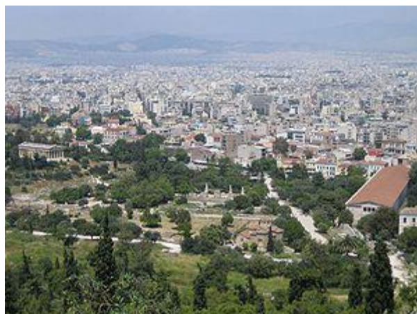
Η Αρχαία Αγορά της Αθήνας.